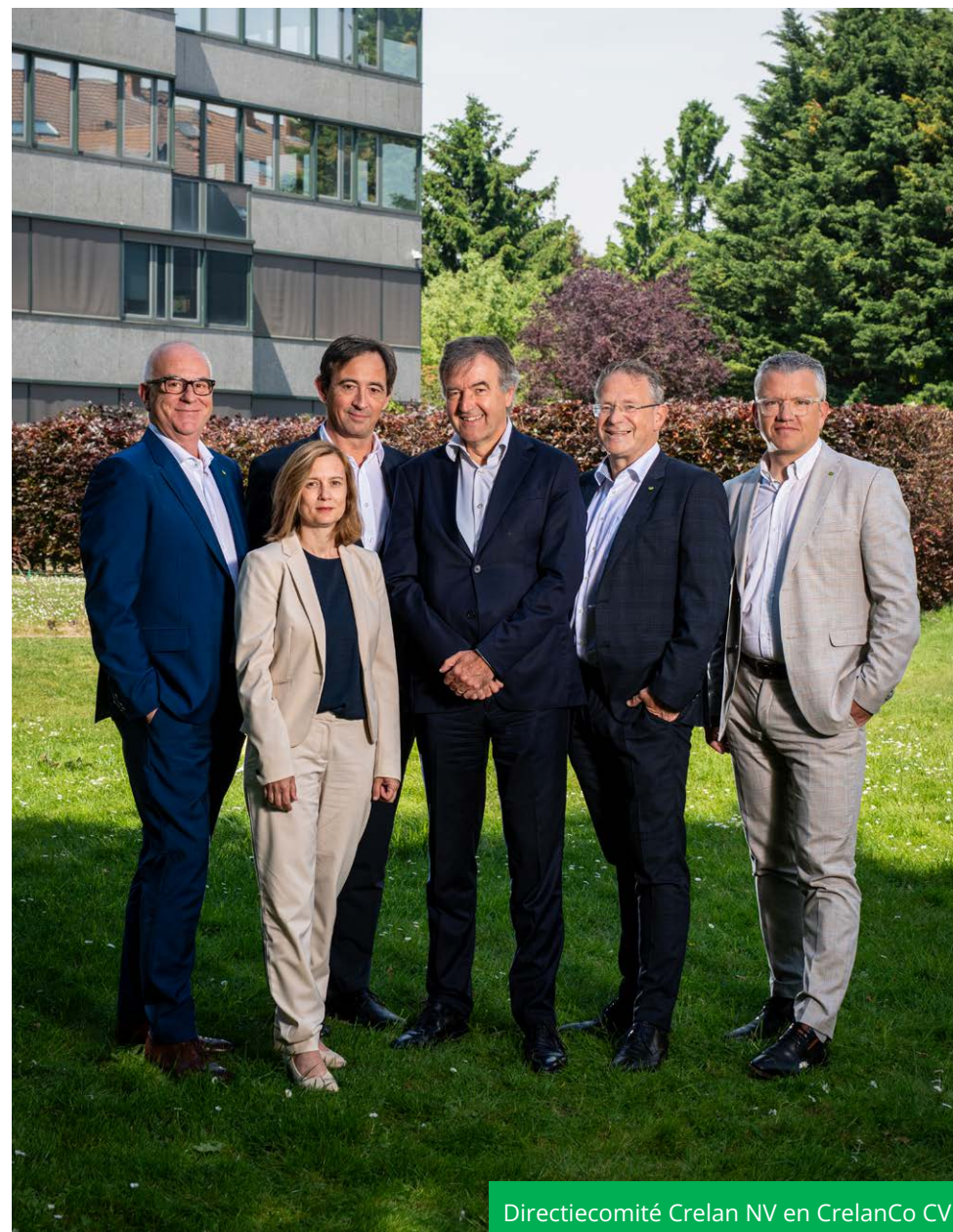
Directiecomité Crelan NV en CrelanCo CV

Volgens artikel 62 § 2 van de Wet van 25 april 2014 op het statuut van en het toezicht op de kredietinstellingen en volgens het reglement van de Nationale Bank van België is de Bank verplicht om de functies die haar bestuurders en effectieve leiders uitoefenen openbaar te maken. Het overzicht op 31/12/2025 is terug te vinden als bijlage aan dit bestuursverslag.