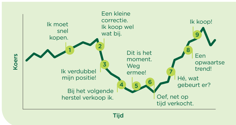
Zo reageert een emotionele belegger op koersschommelingen

Nu, zelfs een fonds met een mooie spreiding ontsnapt niet aan de schommelingen van de markt. Op een goed moment instappen blijft dus de boodschap, maar dat is makkelijker gezegd dan gedaan. Beleggers laten zich weleens misleiden door emoties en kopen vaak op het moment dat het goed gaat en de koersen hoog zijn. Achteraf bekeken blijkt dat dan vaak niet het ideale instapmoment. De oplossing? Je beleggingen spreiden doorheen de tijd.